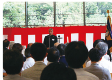
2016年9月5日、新食堂棟「リアン」の竣工式を行いました。