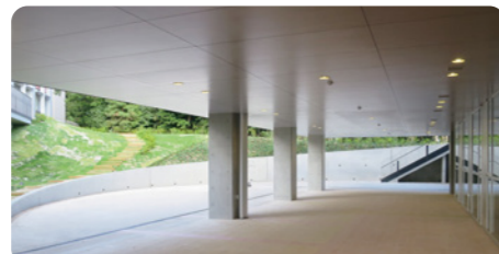
多目的な利用が可能なクラブハウスのピロティ広場

新食堂棟「リアン」 建築面積:1,077.71㎡ 床面積:1,720.28㎡ 階数:地上2階