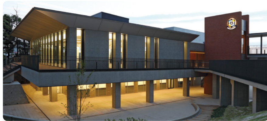
北東面外観(照明点灯時)