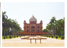
ニューデリーのサファルジャン廟