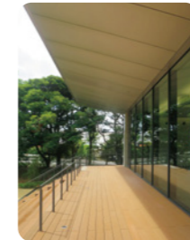
大きな庇の下の開放的な食堂デッキ