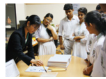
日本文化(書道)を紹介

私の場合、幸運にも、外務省の本省(東京)と在外(海外)、二国間外交とマルチ外交の両方を経験させていただきました。日々新しい業務が舞い込んでくるため、慣れないことばかりではありますが、外務省の仕事色々な面から見る良い機会をいただいたと思っています。愛知県も、近年国際会議を開催する機会が増えていますが、この貴重な4年間に学んだことを愛知県に戻ってからも生かせるよう、引き続き業務に取り組んでいきたいと思っています。