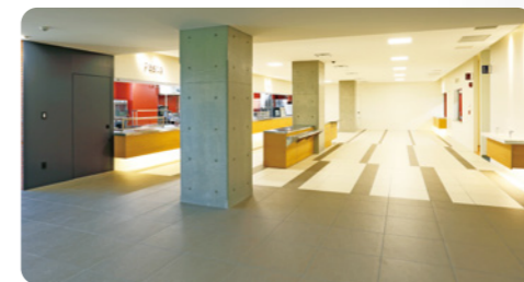
清潔感があり、親しみの持てるサービススペース